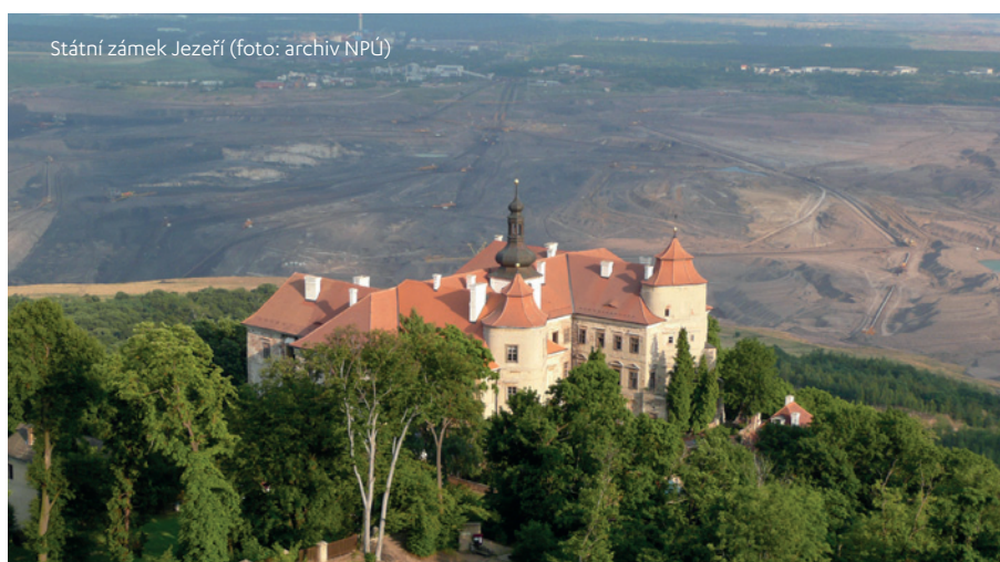
Státní zámek Jezeří

Ve stejné době vyhlásila Evropská komise rok 2018 Evropským rokem kulturního dědictví , což byla zásadní událost, která proměnila pohled na význam a postavení kulturního dědictví v evropské společnosti. Díky velkému ohlasu, který téma v Evropě vzbudilo, se začalo více hovořit o socio-ekonomických dopadech kultury, o její potřebnosti a pozitivním vlivu na hospodářství nebo zaměstnanost. Nosnými evropskými tématy se stal například overturismus, jenž negativně ovlivňoval život obyvatel například v Českém Krumlově a centru Prahy, nebo klimatické změny. Právě aktuální dialog o vlivu klimatických změn na kulturní dědictví se promítl i do zařazení státního zámku Jezeří na seznam sedmi nejohroženějších památek Evropy v roce 2020. Europa Nostra tímto nástrojem upozorňuje Evropu na stav ohrožení vybraných památek. V případě Jezeří jako na následek dlouhodobého zanedbávání objektu a zničení okolní kulturní krajiny povrchovou těžbou.