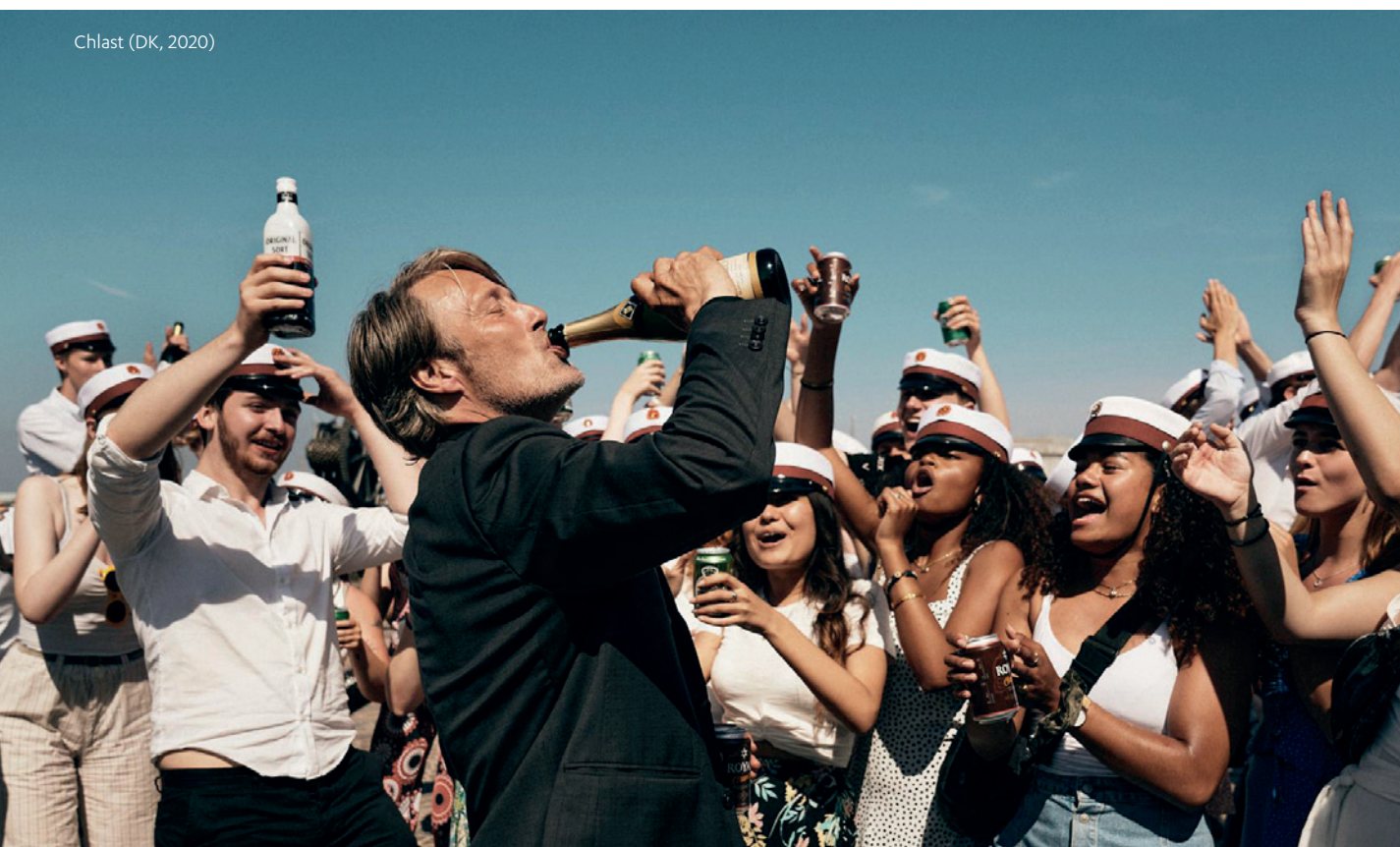
Chlast (DK, 2020)