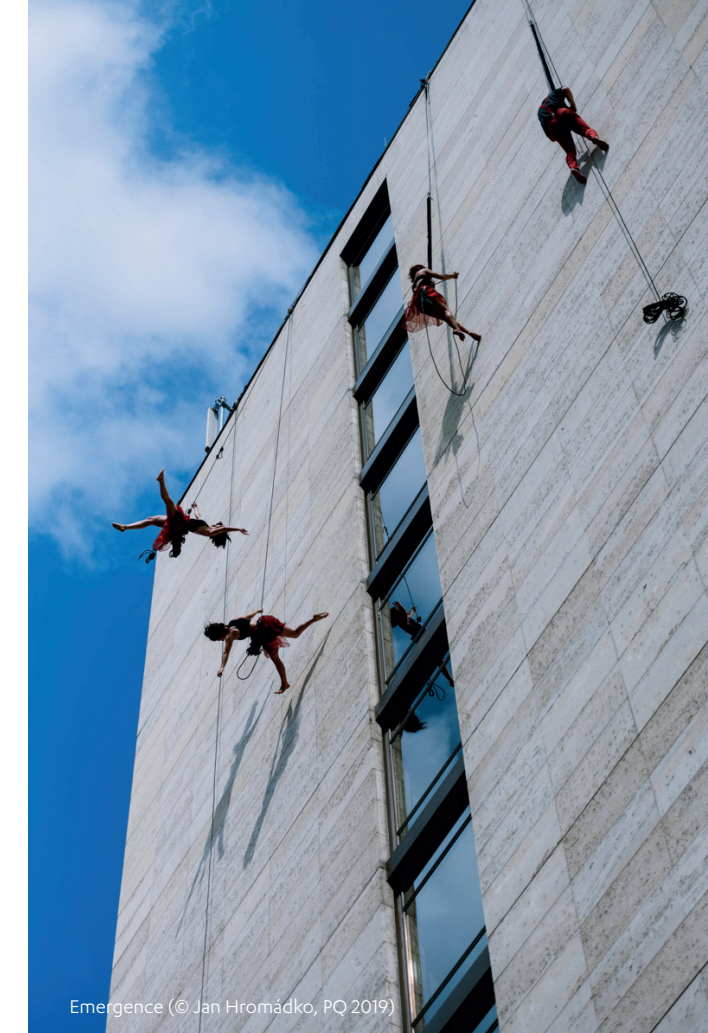
Emergence (© Jan Hromádka, PQ 2019)