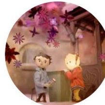
Tonda, Slávka a kouzelné světlo (2023)