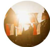
Mezinárodní festival dokumentárních filmů Ji.hlava

4,3 miliony eur – celková částka pro česká kina zapojená v síti Europa Cinemas