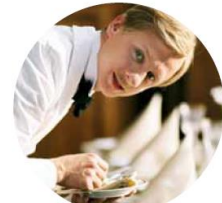
Obsluhoval jsem anglického krále (2006)