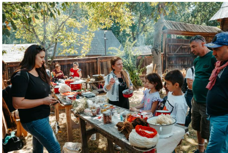
Workshop barvení vlny - oživení tradice v rumunské Sibiu