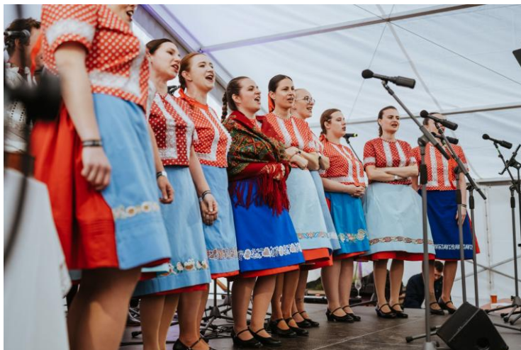
Folklorní festival v Dolních Dunajovicích